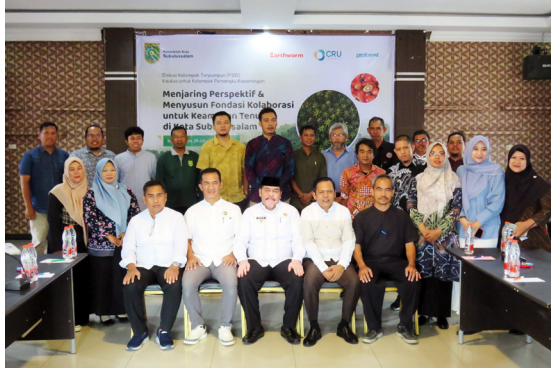
Gambar 3. Diskusi kaukus pemerintah tentang keamanan tenurial Masyarakat Adat dan komunitas lokal