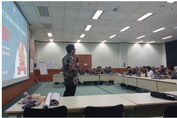
Gambar 19. Pelatihan Penerapan HRDD untuk AAL