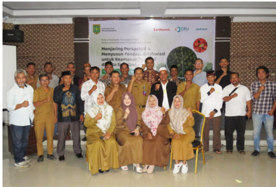
Gambar 1. Diskusi kaukus masyarakat tentang keamanan tenurial Masyarakat Adat dan komunitas lokal

Antara Juni hingga Agustus 2025, program ini mendokumentasikan perspektif para pemangku kepentingan utama—termasuk pemerintah daerah, pelaku sektor swasta, masyarakat adat dan komunitas lokal, serta organisasi masyarakat sipil—terkait isu keamanan tenurial dan peluang kolaborasi untuk menghormati serta melindungi hak-hak masyarakat adat dan komunitas lokal. Proses dokumentasi ini bertujuan menangkap beragam pandangan, mengidentifikasi titik temu dan perhatian bersama, serta menyediakan dasar bukti bagi dialog. Temuan tersebut menjadi masukan utama dalam pelaksanaan Multi-Stakeholder Dialogue (MSD) di Kota Subulussalam pada 25 September 2025.