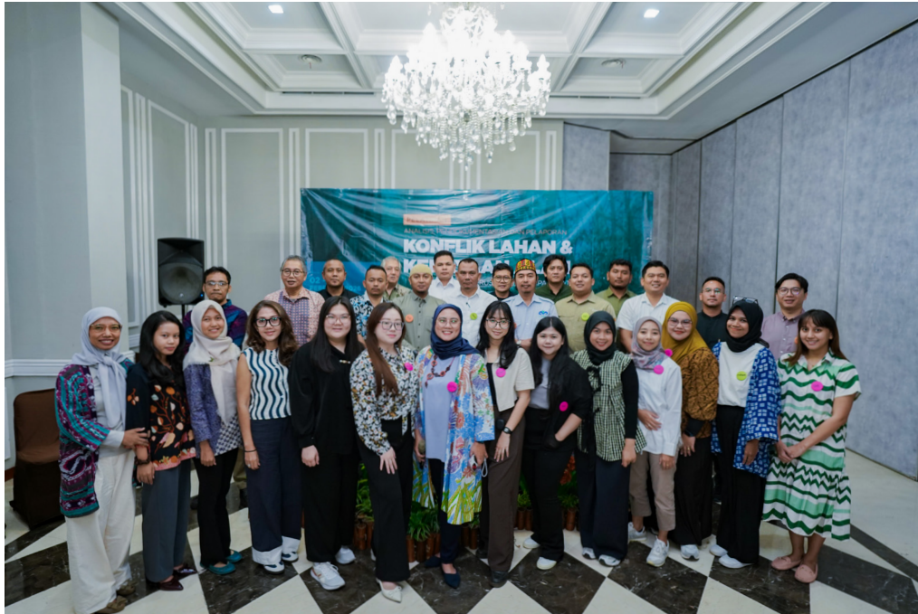
Gambar 11. Pelatihan Analisis, Dokumentasi, dan Pelaporan Konflik bagi Staf Perusahaan Kelapa Sawit

Pelatihan Analisis Konflik, Dokumentasi, dan Pelaporan selama dua hari telah dilaksanakan pada 2-3 Februari 2026 di Hotel Royal Bogor, Bogor, dengan melibatkan 21 peserta (7 perempuan dan 14 laki-laki) yang berasal dari perusahaan perkebunan (growers) dan pembeli perantara. Pelatihan ini bertujuan memperkuat kapasitas peserta dalam mendokumentasikan dan melaporkan konflik lahan serta sumber daya alam secara sistematis sebagai bagian dari praktik bisnis yang bertanggung jawab dan tata kelola perusahaan yang baik di sektor kelapa sawit. Kegiatan ini semula dijadwalkan pada Desember 2025, namun ditunda akibat banjir dan longsor yang melanda sejumlah wilayah di Aceh, Sumatera Utara, dan Sumatera Barat.