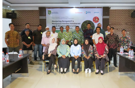
Gambar 4. Diskusi kaukus perusahaan tentang keamanan tenurial Masyarakat Adat dan komunitas lokal