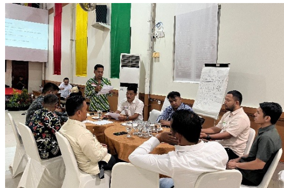
Gambar 6. Dialog Multi-pihak 1 di Kota Subulussalam. Diskusi