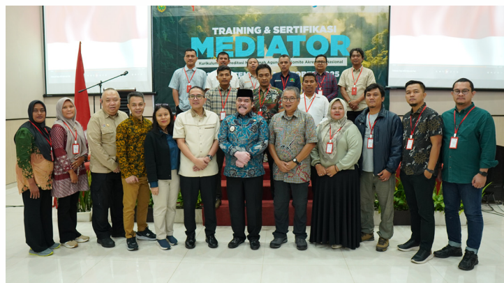
Gambar 10. Diskusi kaukus Perusahaan tentang keamanan tenurial Masyarakat Adat dan komunitas lokal