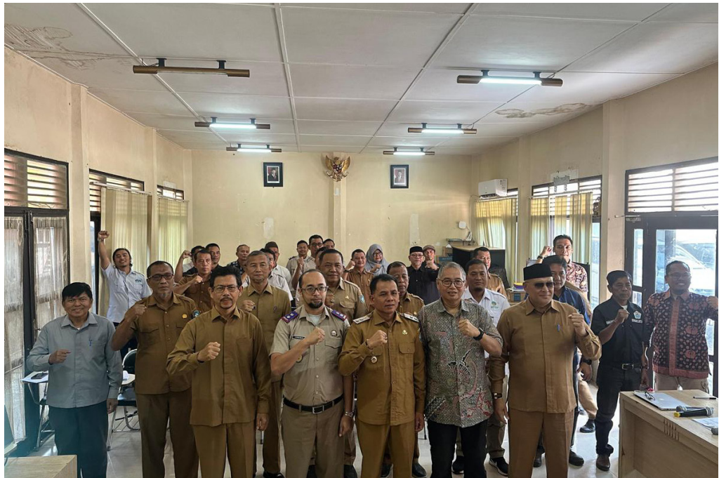
Gambar 14. Sosialisasi PIRK di Kabupaten Aceh Selatan

Konflik lahan dan sumber daya di Indonesia tetap menjadi hambatan utama bagi pembangunan berkelanjutan, dipicu oleh klaim yang tumpang tindih dan ketidakpastian status kepemilikan. Di wilayah barat daya Aceh, Proforest, CRU Indonesia, dan Earthworm Foundation mengembangkan Peta Indikatif Risiko Konflik (PIRK) untuk memprediksi dan mencegah sengketa. Dengan mengintegrasikan analisis spasial, data konflik, dan masukan pemangku kepentingan, PIRK memperkuat tata kelola, kepastian investasi, dan keamanan tenurial melalui aksi terkoordinasi lintas pemangku kepentingan.