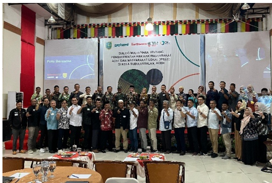
Gambar 5. Dialog Multi-pihak 1 di Kota Subulussalam. Pembukaan