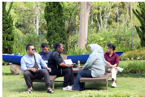
Gambar 13. Pelatihan Lanjutan Penilai dan Mediator, Dolok Sanggul. Simulasi