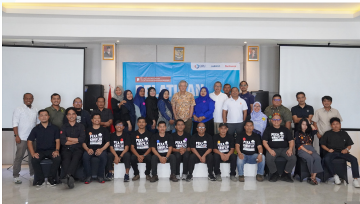
Gambar 7. Dialog Multi-pihak 1 di Kota Subulussalam. Pembukaan

Berdasarkan Pelatihan Peka Konflik yang telah dilaksanakan, sebanyak 15 peserta (3 perempuan dan 12 laki-laki) terpilih untuk mengikuti Pelatihan Mediator Bersertifikat Mahkamah Agung selama lima hari yang diselenggarakan di Coffee Hotel Akasi Dolok Sanggul (CHADS) pada 27 September hingga 1 Oktober 2025. Pelatihan ini mengacu pada kurikulum resmi Mahkamah Agung Republik Indonesia dan membekali peserta dengan pengetahuan dasar serta keterampilan praktis dalam teknik mediasi. Selain itu, program ini juga menekankan standar etika, profesionalisme, dan prinsip imparialitas yang harus dijunjung mediator dalam memfasilitasi proses penyelesaian sengketa.