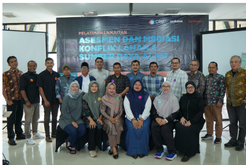
Gambar 12. Pelatihan Lanjutan Penilai dan Mediator, Dolok Sanggul. Acara pembukaan