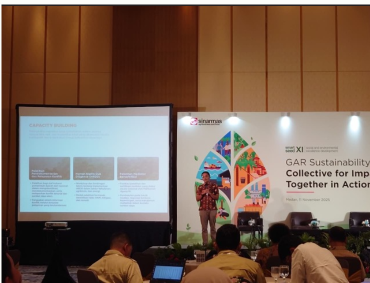
Gambar 26. Smartseed yang diselenggarakan Sinarmas, Medan. Ginjar mempresentasikan program CRU Indonesia.