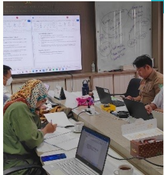
Gambar 23. Pertemuan Pengembangan Program bersama PKTHA.