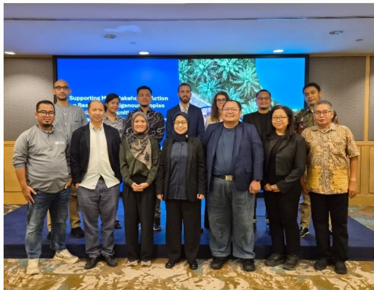
Gambar 25. Pertemuan Koordinasi dengan Para Pemberi Dana IPLC selama RSPO 2025 di Kuala Lumpur. Acara penutupan