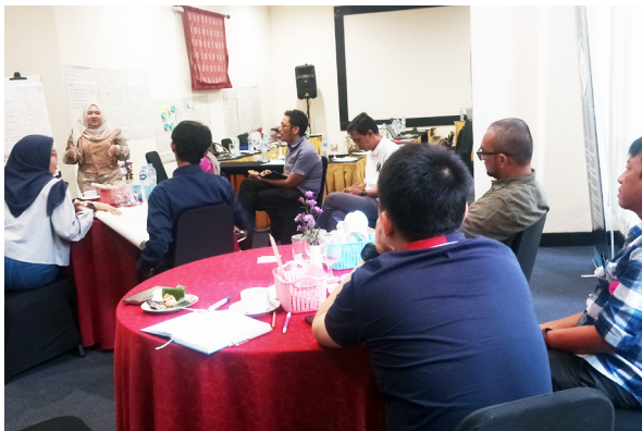
Gambar 20. Pelatihan HRDD dan Mekanisme Pengaduan Keluhan, Bandung