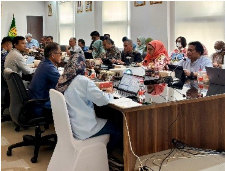
Gambar 22. Pertemuan Mitra Strategis ATR/BPN.