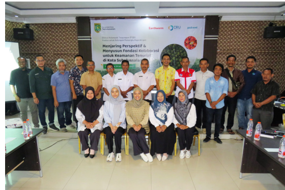
Gambar 2. Diskusi kaukus CSOs tentang keamanan tenurial Masyarakat Adat dan komunitas lokal