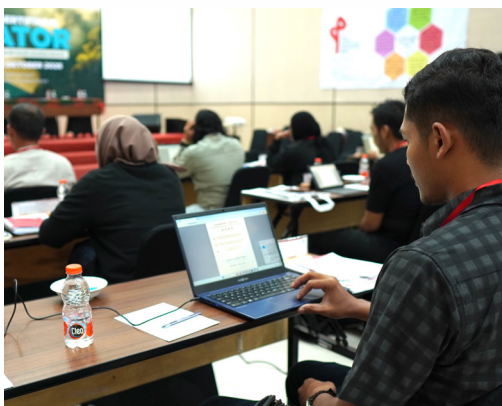
Gambar 9. Pelatihan Mediator Bersertifikat MA, Dolok Sanggul. Ujian akhir