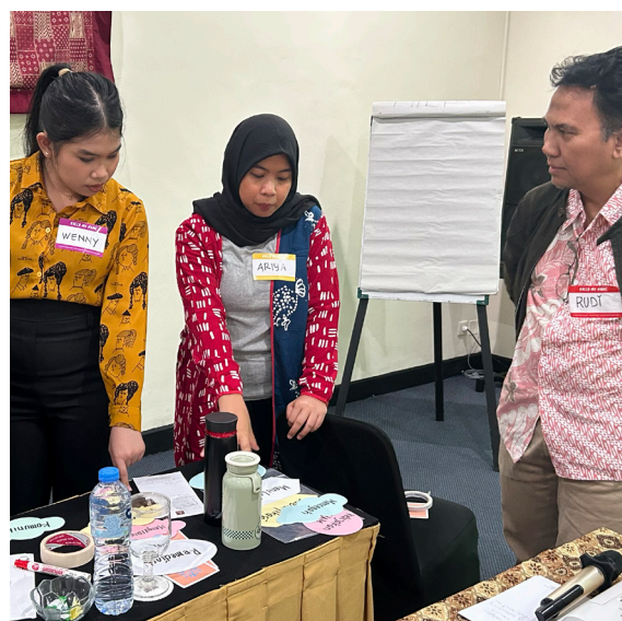
Gambar 17. Pelatihan HRDD Angkatan Pertama, Bandung. Kerja kelompok

Secara strategis, inisiatif ini semakin memperkuat posisi CRU Indonesia sebagai penyedia keahlian HRDD terdepan di Indonesia, khususnya pada sektor-sektor yang berada di persimpangan antara isu tenurial lahan, pengelolaan sumber daya alam, dan hak-hak masyarakat dalam operasi bisnis. Melalui dukungan terhadap penguatan sistem uji tuntas HAM perusahaan, CRU Indonesia berkontribusi pada pengurangan risiko konflik sekaligus mendorong tata kelola lahan yang lebih inklusif dan berkelanjutan.