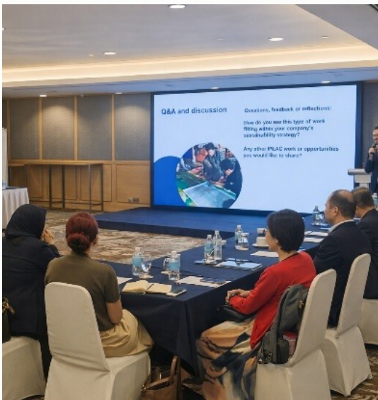
Gambar 24. Pertemuan Koordinasi dengan Para Pemberi Dana IPLC selama RSPO 2025 di Kuala Lumpur. Sesi Tanya Jawab