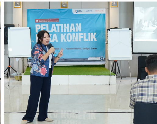
Gambar 8. Diskusi kaukus CSOs tentang keamanan tenurial Masyarakat Adat dan komunitas lokal