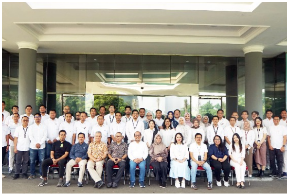
Gambar 18. Pelatihan Penerapan HRDD untuk AAL. Pembukaan