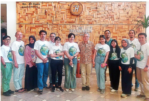
Gambar 16. Pelatihan HRDD Angkatan Pertama, Bandung

Pada tahun 2025, CRU Indonesia memperluas upayanya dalam memperkuat tata kelola lahan dan sumber daya alam yang bertanggung jawab melalui serangkaian program peningkatan kapasitas Human Rights Due Diligence (HRDD) bagi sektor swasta. Sepanjang tahun tersebut, empat program pelatihan telah diselenggarakan, terdiri dari dua pelatihan umum lintas perusahaan, satu pelatihan lintas perusahaan khusus sektor kelapa sawit yang dilaksanakan bersama Palm Oil Collaboration Group (POCG), serta satu pelatihan internal (in-house training) bagi PT Astra Agro Lestari.